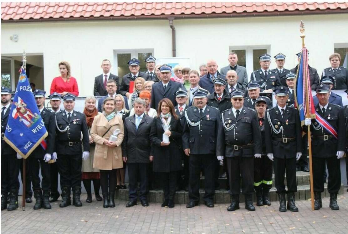
90-lecie OSP Witosław