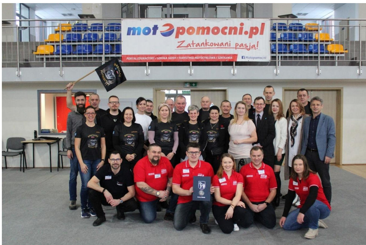
Warsztaty edukacyjne dla motocyklistów „Bezpieczny i MotoPomocny Motocyklista”

Dokumentacja fotograficzna z imprez współorganizowanych przez organizacje pozarządowe – przykłady: