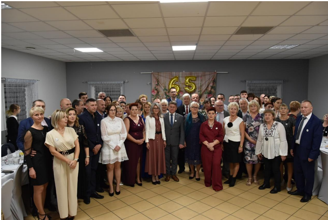
65-lecie KGW Wiele